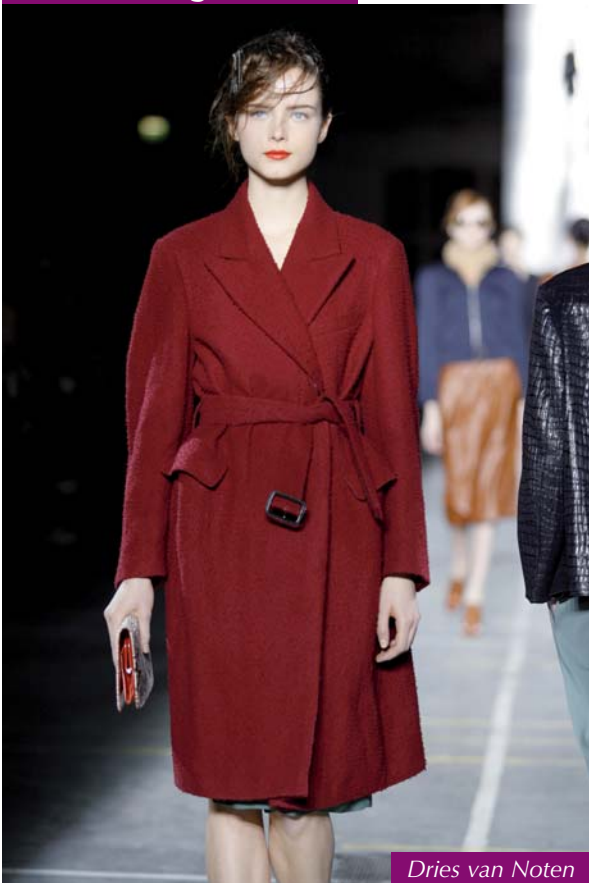
Dries van Noten

Une veste trop grande portée sur un paire de cuissardes. Un manteau qui flotte, presque lourd et dont les pans romantiques battent sur le froufrou d'une robe légère (Burberry Prorsum). Un pardessus qu'on dirait volé à un homme, mais de couleur fille et noué comme un peignoir féminin (Dries Van Noten). Un pantalon taille très, très haute, de coupe carotte, large à la taille comme un sarouel et serré en bas. Bref, porter une pièce légèrement trop grande signe l'allure hiver 2009 et signera celle de 2010. Qu'on pense, aussi, au succès du jeans dit «Boyfriend» parce que porté une taille trop grand comme s'il avait été piqué à son homme.